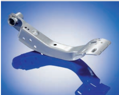
ZSB Bremspedal 320 x 150 x 60 mm