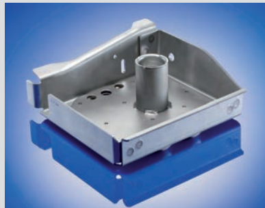
Federteller 250 x 250 x 100 mm

lungen für den Kunden, mit starken Kooperationspartnern abgewickelt. Ihre Gesprächspartner sind qualifizierte Ingenieure und Techniker. Just-in-time, Simultaneous Engineering und Wertanalyse sind Bestandteil unserer täglichen Arbeit.