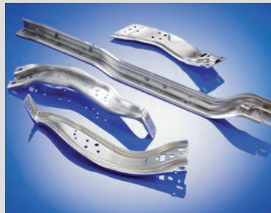
Diverse Montageträger aus Aluminium 500 x 150 x 70 mm