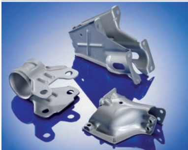
Diverse Folgeverbundteile mit anschließender Montage | 250 x 100 x 100 mm