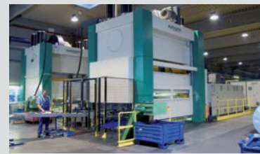
6.300 kN Stanz- automaten