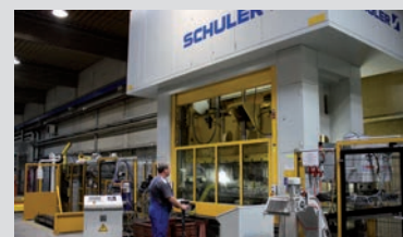
4.000 kN Stanz- automat