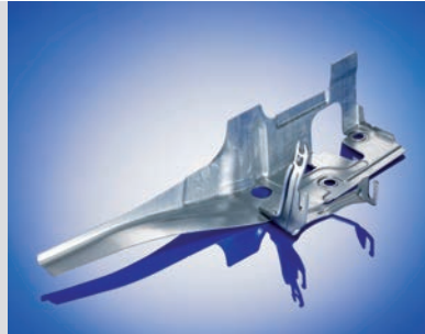
ZSB Verstärkung 350 x 100 x 100 mm